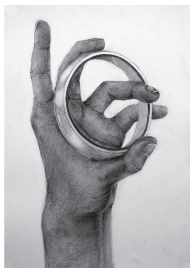
開邦受験コース（参考作品）